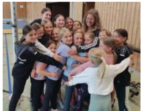
„Theresa ist wieder da“