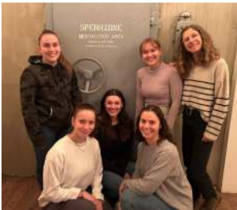
Jahresabschluss der jungen Trainerinnen im Escaperoom