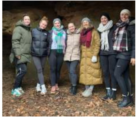
Wochenende Altmühltal 05.01.-07.01.