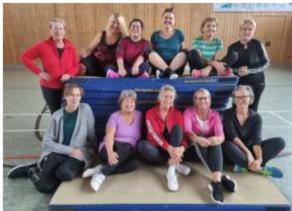
Bauch Beine Po und mehr