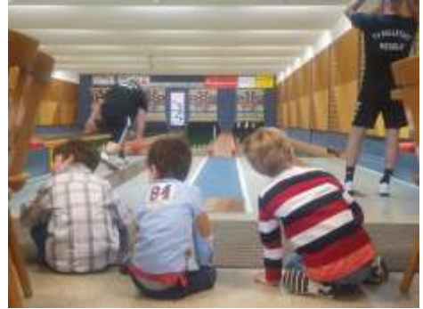
Nachwuchs schaut zu

Da die Kegelbahn in der Schulturnhalle durch einen Wasserschaden kurzfristig ausgefallen ist, haben wir den Mannschaften vom SV-Dörfleins und der Königshof-Elf im ersten Halbjahr unsere Kegelbahn zur Verfügung gestellt. Sie konnten deshalb am laufenden Wettkampfbetrieb teilnehmen und mussten keine Kämpfe absagen. Mittlerweile kegeln beide Mannschaften wieder auf